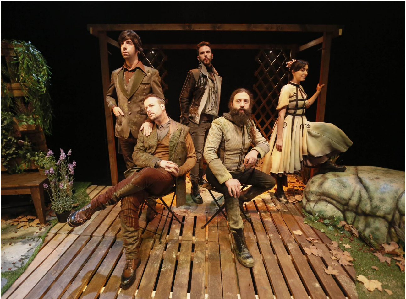
Impromadrid en el ensayo general de su obra 'Jardines'

La compañía Impromadrid estará en el Teatro Galileo hasta el domingo