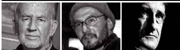
ADOLFO MARSILLACH, RODRIGO GARCÍA Y TADEUSZ KANTOR

19.30 en el Ateneo de Madrid (Prado, 21). Esto es para los muy teatraleros, capaces de ir en busca de joyas efímeras recogidas en vídeo. Se trata de una serie de grabaciones que el Centro de Documentación Teatral ha ido acumulando a lo largo de los últimos 25 años. Podrás revisar así trabajos de españoles como Adolfo Marsillach, Rodrigo García o La Zaranda, junto a auténticos fetiches de coleccionista, como son los montajes de Bob Wilson o Tadeusz Kantor.